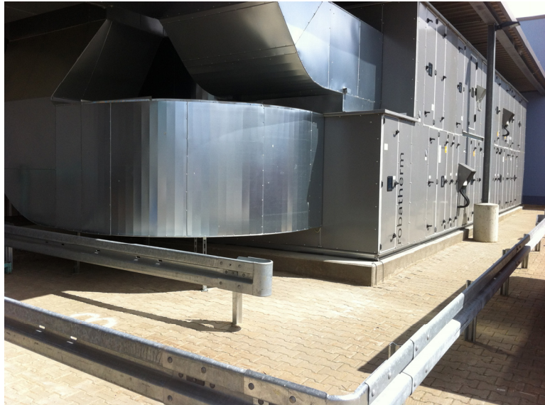
Lüftungsgerät mit integrierter Kälte