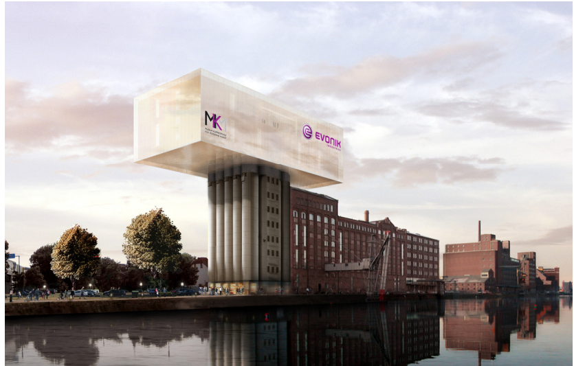
Modell-Museum Küppersmühle für moderne Kunst