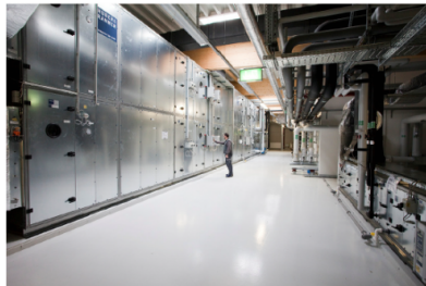
L ftungs-Zentralger t Waferfab 180.000 m /h