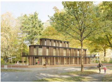
Visualisierte Ansicht der Kita "KIDDIE"

In dem im Erdgeschoss vorgesehenen Nestbereich werden 24 Kinder(u3) untergebracht, 36 ??ber dreij??hrige Kinder (03) werden im ??bergeschoss betreut. Das architektonisch anspruchsvolle Geb??ude wurde in vorgefertigter Holzständerbauweise sowie einer Holzfassade vorgesehen, welche sich mit dem dreieckig gerundeten Grundriss in der Voluminit??t auch mit den abgetreppten Terrassen am Grundst??ck und der fr??heren Bebauung ausrichtet.