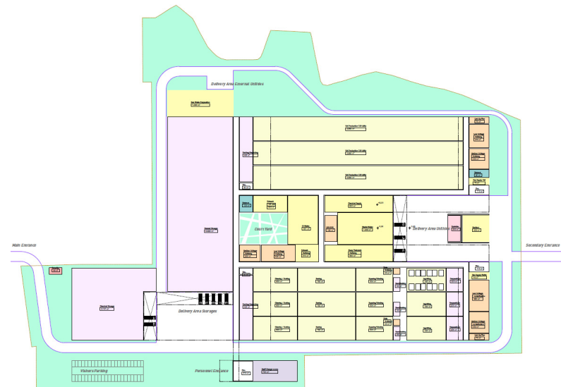
Konzeptstudie Enfield Solar Ltd.